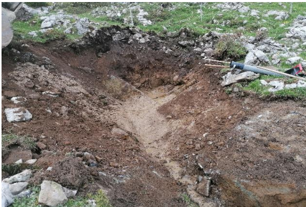
Wir sind fündig, die Quelle fließt aus dem Boden