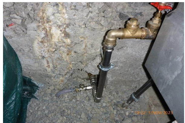
Das Herzstück im Keller, der frostsichere Wassertank. So steht auch im Winter bestes Quellwasser den Gästen zur Verfügung