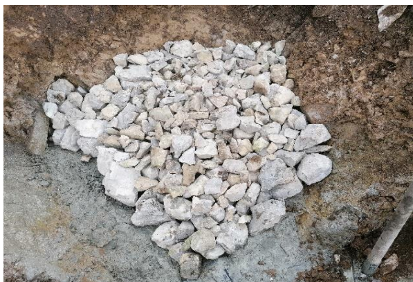
Die Quelle wird gefasst