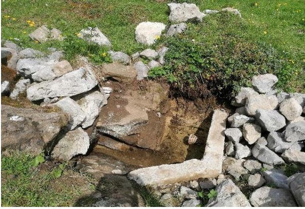
Ursprüngliche Fassung der Trinkwasserversorgung des Clubheims