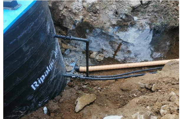
Leitungen werden verlegt, der Sammelschacht wird versetzt und angeschlossen