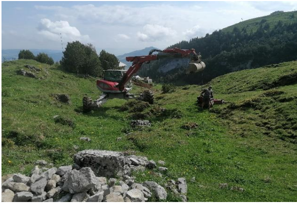
Start der Sanierungsarbeiten. Freilegen des Wasservorkommens