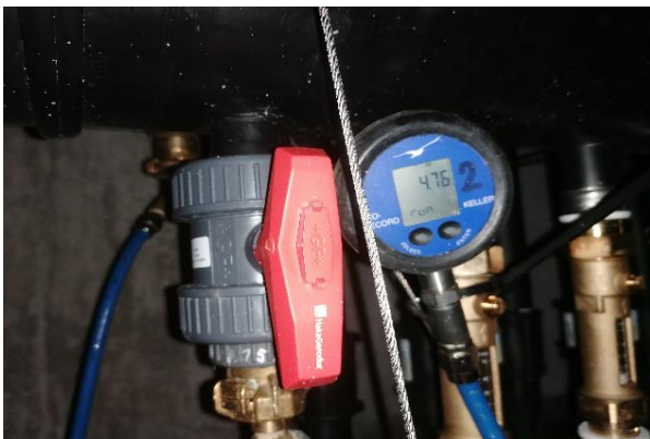
Zwischendruckprüfung und Drucküberwachung während der Aushubarbeiten. Abschlussdichtigkeitsprüfung mit Aufzeichnung und Dokumentation.