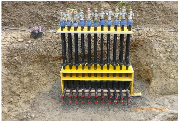
Versetzen des Erdsondenverteilers