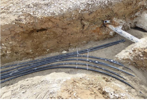
Verlegen der Anbindeleitungen