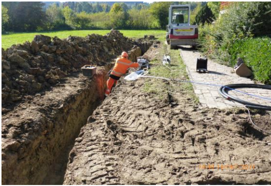
Verlegen der Anbindeleitungen