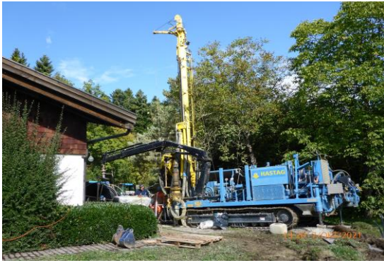
Erdsondenbohrung durch eine externe Bohrfirma.