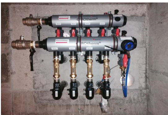
Fertig montierter Erdsondenverteiler während der Druckprüfung