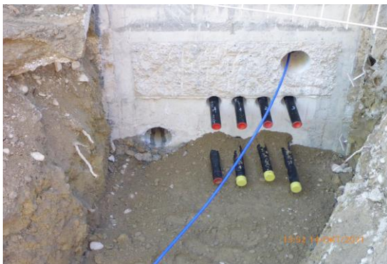
Hauseinführung der einzelnen Erdwärmesonden