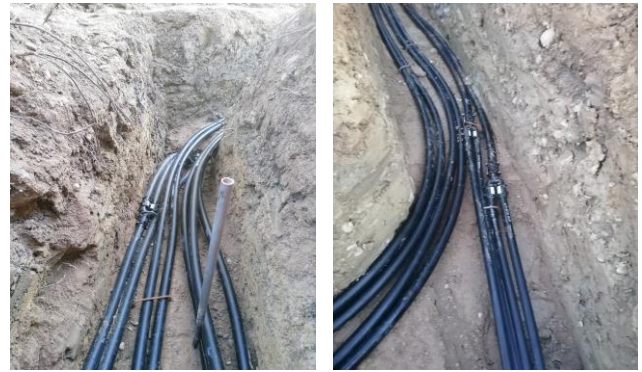
Geordnet verlegte Anbindeleitungen