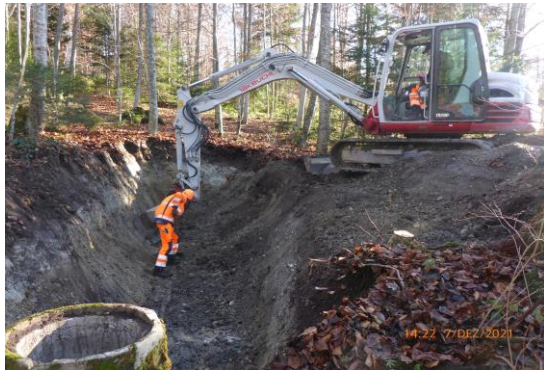
Die bestehende Quellwasserfassung legen wir frei und suchen weitere Wasservorkommen.