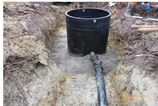
Der Sammelschacht kommt in der Nähe der Quellfassung zu liegen.