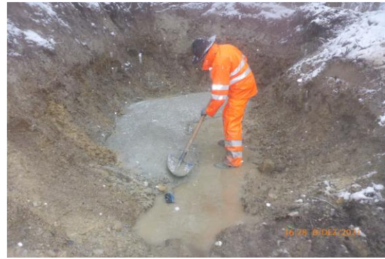
Die Quelle wird neu gefasst.