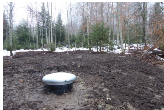
Nach Abschluss der Bauarbeiten ist das Gelände wieder angepasst und rekultiviert.