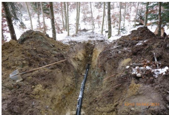
Alle Verbindungsleitungen werden ersetzt und neu verlegt.