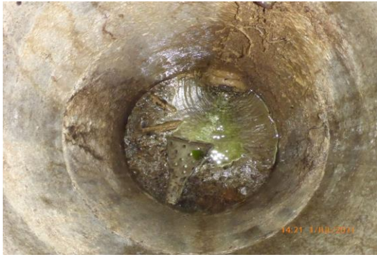
Die Schächte sind in einem veralteten Zustand und sind schlecht zu reinigen.