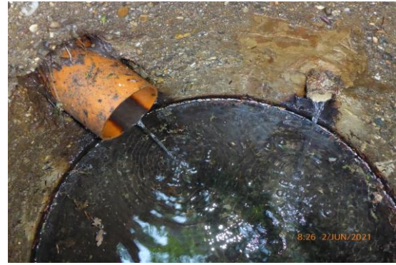
Bei den undichten Anschlüssen wachsen Wurzeln ein. Verschmutztes Wasser kann eindringen.