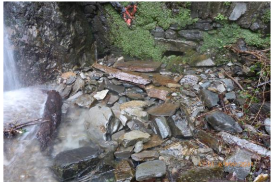
Abgeschlossene Arbeiten, die Fassung wurde mit Steinplatten abgedeckt.