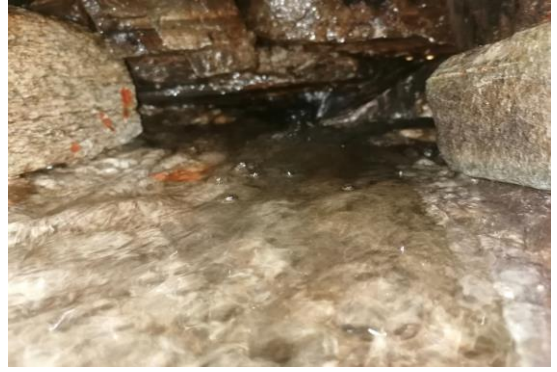
Wasserfluss ca. 800 Liter / Minuten