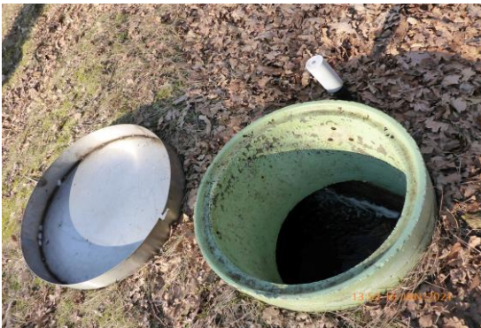
Wasserreservoir mit ungenügender Abdeckung.