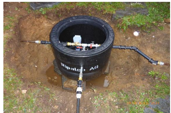
Verteilschacht mit Wasserfilter.