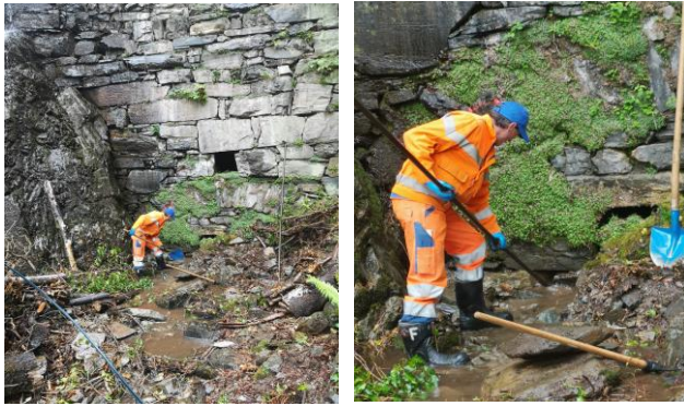
Wasserfassung neu erstellen.