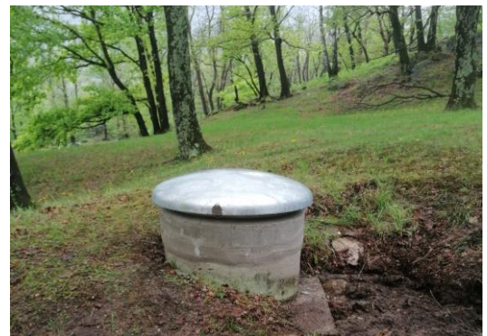
Reservoir mit neuer Schachtabdeckung, abschliessbar und Insektengeschützt.