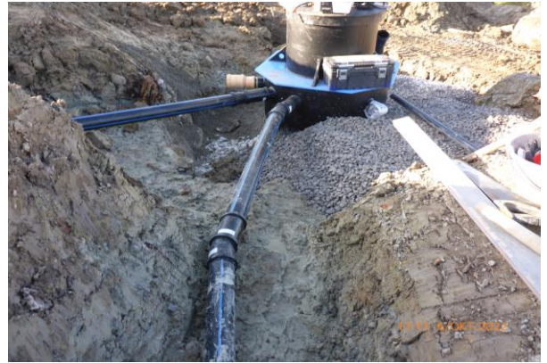
Versetzen von Schächten und verlegen der Leitungen