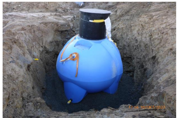
An hand des Wasserbedarfs und Verwendungszweckes wird das Wasserreservoir dimensioniert