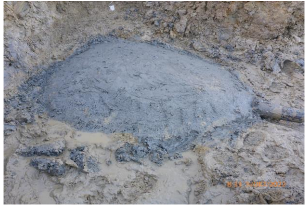
Fertig erstellte Quellwasserfassung