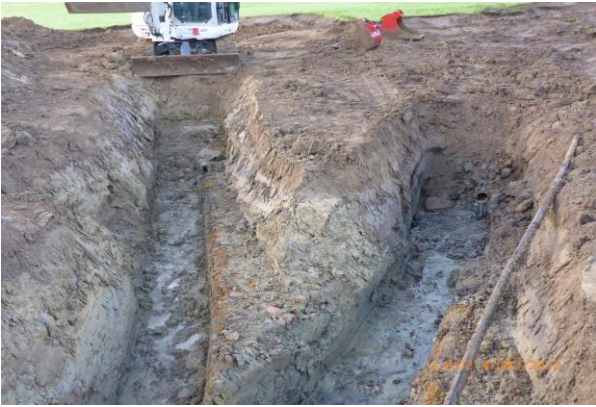
vorsichtiges Freilegen von Wasservorkommen