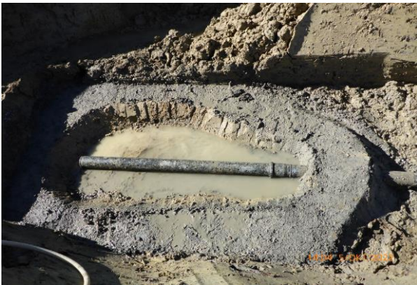
Quellwasserfassungen sind den örtlichen Gegebenheiten angepasst