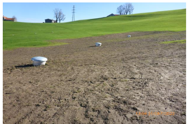
Die Bauarbeiten sind ausgeführt. Das Gelände wieder hergestellt.