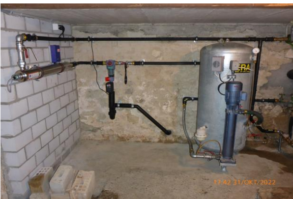
Installation von einer UV-Entkeimungsanlage und dem dazugehörigen Wasserfilter