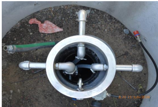
Einsicht in den Gasbrunnen.