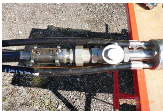
Der Brunnenkopf wird von uns, den Ansprüchen entsprechend, umgebaut.