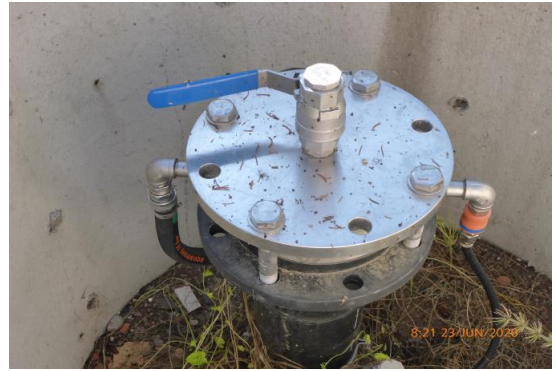
Abdichtung der Brunnenrohre.