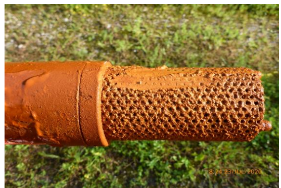
Ablagerungen im Pumpenbereich. Sie werden von uns gereinigt, revidiert und geprüft.