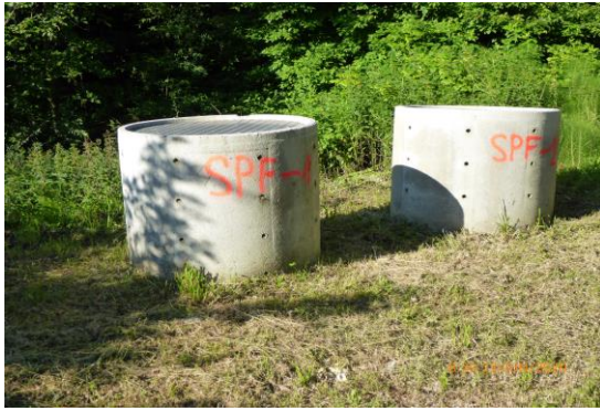
Der Kopfbereich wird mit Betonrohren, zum Schutz vor Beschädigungen, gesichert.