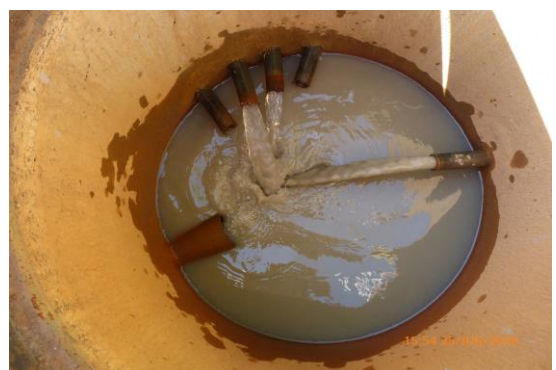
Das abgepumpte Wasser wird in Schächten gesammelt und der Reinigungsanlage zugeführt.