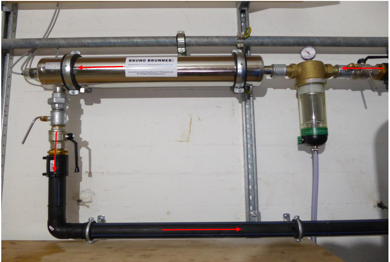
Gesamtansicht und einfache Montage der Ultraviolett-Entkeimungsanlage (UV-Entkeimung)