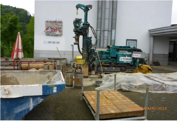
Brunnenbohrung bis in die Tiefe von 27.00 Meter, mit anschließendem Brunnenrohreinbau