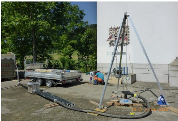
Brunnenreinigung und anschließender Pumpversuch zur Bestimmung der Ergiebigkeit